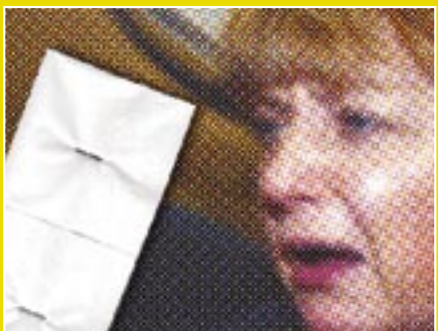
Newsletter-Abonnent/innen: 9.625 Verschickte Taschentücher: 7.235

Bundestagspräsident Lammert will den Compact-Erfolg aus dem Vorjahr zunichte machen: Auch auf unseren Druck hin hatte der Bundestag eine umfassende Transparenzpflicht für Politiker-Nebeneinkünfte beschlossen. Doch Lammert verweigert die Umsetzung mit einem Vorwand: Klagen von Abgeordneten gegen das Gesetz beim Bundesverfassungsgericht. Tausende schicken Lammert Faxe und E-Mails oder rufen ihn an. Aber Lammert setzt sich weiter über geltendes Recht hinweg.