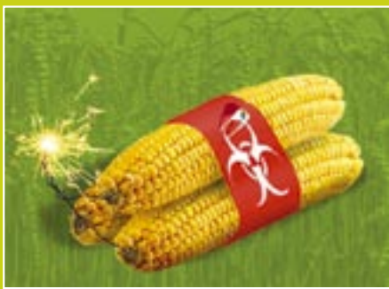
Newsletter-Abonnent/innen: 5.968 Aktionsteilnehmer/innen: 7237

Spendenkonto: Compact e.V. KontoNr. 698 000 0061 BLZ 251 205 10 Bank für Sozialwirtschaft