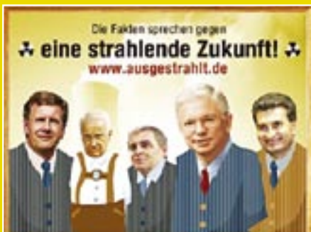
Newsletter-Abonnent/innen: 6.784 Versendete E-Mails: 17.061

Landwirtschaftsminister Seehofer will die wichtigste Hürde gegen den großflächigen Anbau von Gentechnik in der Landwirtschaft beseitigen: das hohe Haftungsrisiko. Zudem soll das Standortregister mit allen Gentech-Feldern nicht mehr öffentlich sein. Unter dem Motto »Stoppt Seehofer« rufen wir Bürger/innen auf, dem Minister E-Mails zu senden. Über 7.000 machen mit und haben einen ersten Teilerfolg: Der Minister schaltet erstmal einen Gang zurück und merkt, dass er sich bei dem brisanten Thema die Finger verbrennen kann.