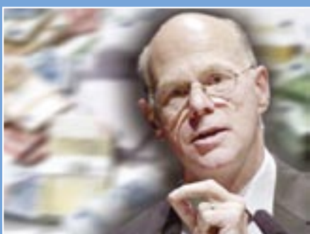
Newsletter-Abonnent/innen: 8.944 Aktionsteilnehmer/innen: 2.163

Die Ministerpräsidenten Stoiber, Koch, Müller, Wulff & Oettinger wollen die Atomkraft wieder hoffähig machen. Und damit den Anträgen der Atombetreiber auf Laufzeitverlängerung ihrer Meiler den Boden ebnen. 17.000 von Compact-Aktiven versandte interaktive E-Cards halten mit Argumenten dagegen.