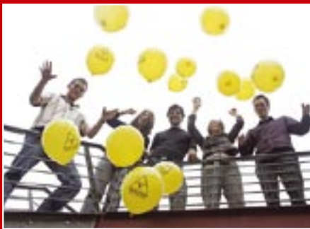
Das Compact-Team während der Ballonaktion

Das Engagement tausender Compact-Aktiver hat all die Aktionen im zurückliegenden Jahr möglich gemacht. Herzlichen Dank!