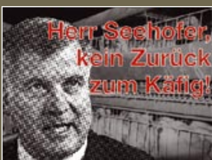
Newsletter-Abonnent/innen: 10.379 Versendete Briefe: 2.350

Angela Merkel hat zum Energiegipfel ins Kanzleramt geladen. Wirtschaftsminister Glos und die Chefs der Atomkonzerne wollen beim Gipfel Druck für längere Laufzeiten ihrer Meiler machen. Compact-Aktive schicken ihnen tausende Taschentücher per Post, damit sie ihre Abschiedstränen trocknen. Schließlich muss die Zeit der Atomkraft ein Ende finden. Unser Signal: Jetzt muss ausgestiegen werden! Mehr Tempo beim Atomausstieg!